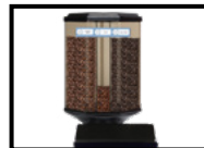
Contenant à grains allongé