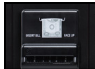
Accepteur de billets